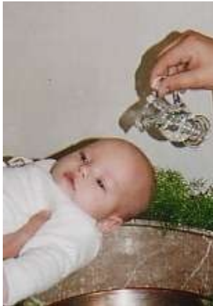
Taufe eines Neugeborenen

Rituale und Traditionen spielen in allen Religionen eine große Rolle. Welche sind die wichtigsten, was ist ihre Bedeutung und was ist erforderlich, damit der Glaube lebendig bleibt?