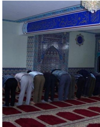
Muslime beim Gebet